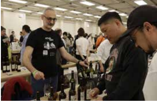
ღვინის წარმოების უძველეს ტრადიციებსა და კულტურას გაეცნენ.

ღვინის ეროვნული სააგენტოს მხარდაჭერით, ღვინის მწარმოებელი ხუთი საოჯახო მარანი იაპონიის დედაქალაქ ტოკიოში გამართულ გამოფენაში „RAW Wine Tokyo“ მონაწილეობდა. იაპონელ ღვინის პროფესიონალებსა და მომხმარებლებს შესაძლებლობა მიეცათ, დაეგემოვნებინათ ქართული მარნების: „ანდრეას ღვინო“, „ართანა ვაინსი“, „იორა“, „მანავი ვაინსი“, „გაბრიელი ვაინსი“ ღვინოები. გამოფენის სტუმრები ქართული