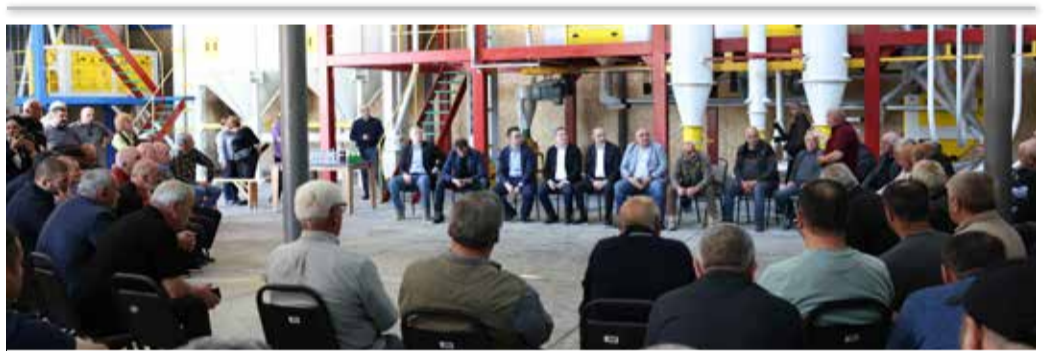
დავით სონდულაშვილი მეხორბლე ფერმერებს შეხვდა

დავით სონდულაშვილმა კომპანიის მსხლის თანამედროვე სტანდარტების ინტენსიური ბაღიც დაათვალიერა, სადაც მსხლის ევროპული ჯიშები - კაიბერი, კონფერენსი და ვილიამსია გაშენებული. მინისტრი კომპანიის ვენახშიც იმყოფებოდა. სასუფრე ყურძნის ჯიშის ვენახი სახელმწიფო პროგრამის ფარგლებში, 2020 წელს, 5 ჰექტარზე გაშენდა. სახელმწიფო თანადაფინანსებამ 27,700 ლარი შეადგინა.