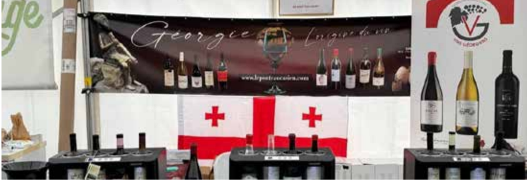
ფესტივალს, რომელიც ქალაქ შალონ-სიურ-სონში (Chalon-sur-Saône) გაიმართა, ყოველწლიურად 10 000-მდე სტუმარი, სომელიეები, ღვინის კომერციული და HoReCa სექტორის წარმომადგენლები ესწრებიან.

ბაზრების დივერსიფიცირებისა და საექსპორტო პოტენციალის გაზრდის მიზნით, ქართული ღვინო საფრანგეთის ღვინისა და გასტრონომიის პრესტიჟულ ფესტივალზე „Les Festives Gourmandes“ ღვინის ეროვნული სააგენტოს მხარდაჭერით და სააგენტოს კონტრაქტორი კომპანიის „Le Pont Caucasion“ ორგანიზებით წარდგა.