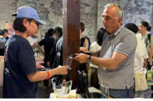
შესაძლებლობა მიეცათ, დაეგემოვნებინათ ქართული მარნების: „იორა“, „მანავი ვაინსი“ და „ბაღდათი ისთეითის“ ღვინოები.

გამოფენაზე მისულ სტუმრებს, ღვინის პროფესიონალებს, კომერციული სფეროს წარმომადგენლებს და მომხმარებლებს