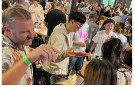
მწარმოებლები იკრიბებიან. გამოფენის ორგანიზატორია ცნობილი ღვინის მაგისტრი საფრანგეთიდან იზაბელ ლეგერონი.

ღვინის ეროვნული სააგენტოს მხარდაჭერით, ღვინის მწარმოებელი სამი საოჯახო მარანი ჩინეთის სახალხო რესპუბლიკის ქალაქ შანხაიში გამართულ გამოფენაში „RAW Wine Shanghai“ მონაწილეობდა. გამოფენაზე „RAW Wine“ (The Artisan Wine Fair) მაღალი ხარისხის ბუნებრივი, ორგანული და ბიოდინამიკური ღვინოების