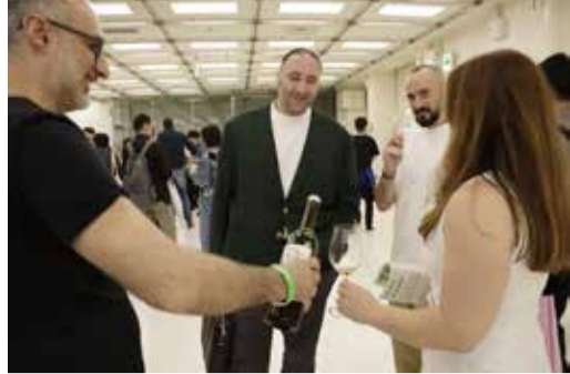
გამოფენაზე ღვინის წარსადგენად ქართველმა მეწარმეებმა მხარდაჭერა იაპონიაში საქართველოს საელჩოსგანაც მიიღეს.

გამოფენაზე „RAW Wine“ (The Artisan Wine Fair) მაღალი ხარისხის ბუნებრივი, ორგანული და ბიოდინამიკური ღვინოების მწარმოებლები იკრიბებიან. გამოფენის ორგანიზატორია ცნობილი ღვინის მაგისტრი საფრანგეთიდან იზაბელ ლეგერონი.